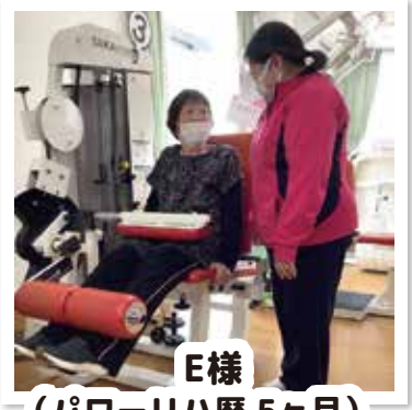
E様 (パワーリハ歴5ヶ月)

E様はコロナ禍が続き、活動量の低下がみられたため、体力の向上を目的に2023年11月よりすこやか生野通所リハビリのご利用を開始されました。リハビリに意欲的で、ご自身で楽しみを見つけ「何事にも挑戦。」と話されています。体力の向上がみられ、今は地域の日帰りバス旅行や、月2回図書館へ読み聞かせに通うなど、積極的に活動されています。3月、好きな歌手のコンサートに行くためにP-WALKで歩かれる距離を少しずつ延ばされていました。「先日、久しぶりに夫と一緒にコンサートへ行ってきた。」と笑顔で話をされ、5月には、「家族と一緒に有馬温泉に行く予約をした。」とも話されておられます。これからも、スタッフ一同サポートして参ります。