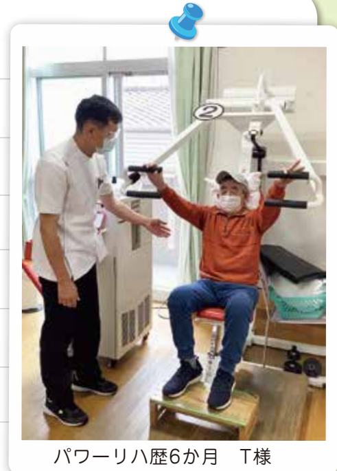
パワーリハ歴6か月 T様

外出機会を増やしてほしいとのご家族様の希望もあり、植木の水やりやゴミ出しなど自宅内での役割も持ちながら、ご自身でも体力がついたことを自覚されスーパーまで買い物へ行かれるなど活動範囲も広がっています。